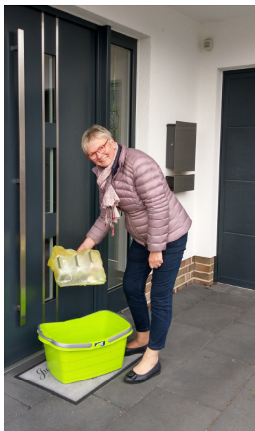
Lieferservice der Büchereimitarbeiter

Die Bücherei ist sonntags von 10:00 – 12:00 Uhr wieder geöffnet. Die Rücknahme findet im Eingangsbereich des Rathauses statt. Eine Ausleihe ist unter Abstandsregelung möglich. Neueste Infos immer auf unserer Internetseite Bücherei Emsbüren/eopac. Darüber können auch Bücher vorbestellt und von uns geliefert werden.