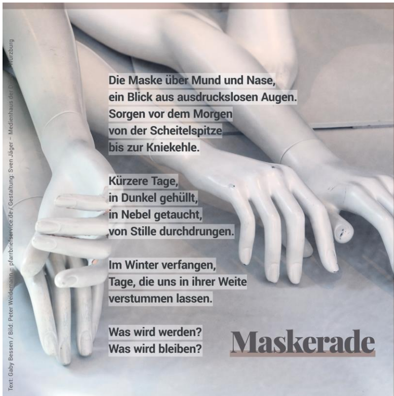
Bild: Text: Gaby Bessen, Layout: Sven Jäger

In allen Gottesdiensten am 17. und 18. April werden wir uns im Kirchspiel Emsbüren in allen Gottesdiensten diesem Anliegen anschließen und für die Verstorbenen in der Corona-Pandemie beten.