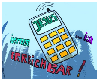
Bild: RKW-Teilnehmerin (Entwurf) / Peter Weidemann (Grafik); In: Pfarrbriefservice.de